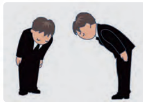
お迎え・ご遺体搬送