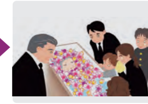
火葬場集合 お別れ