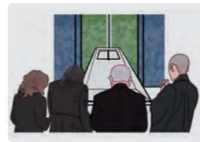
火葬場集合 火葬解散