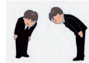
お迎え・ご遺体搬送